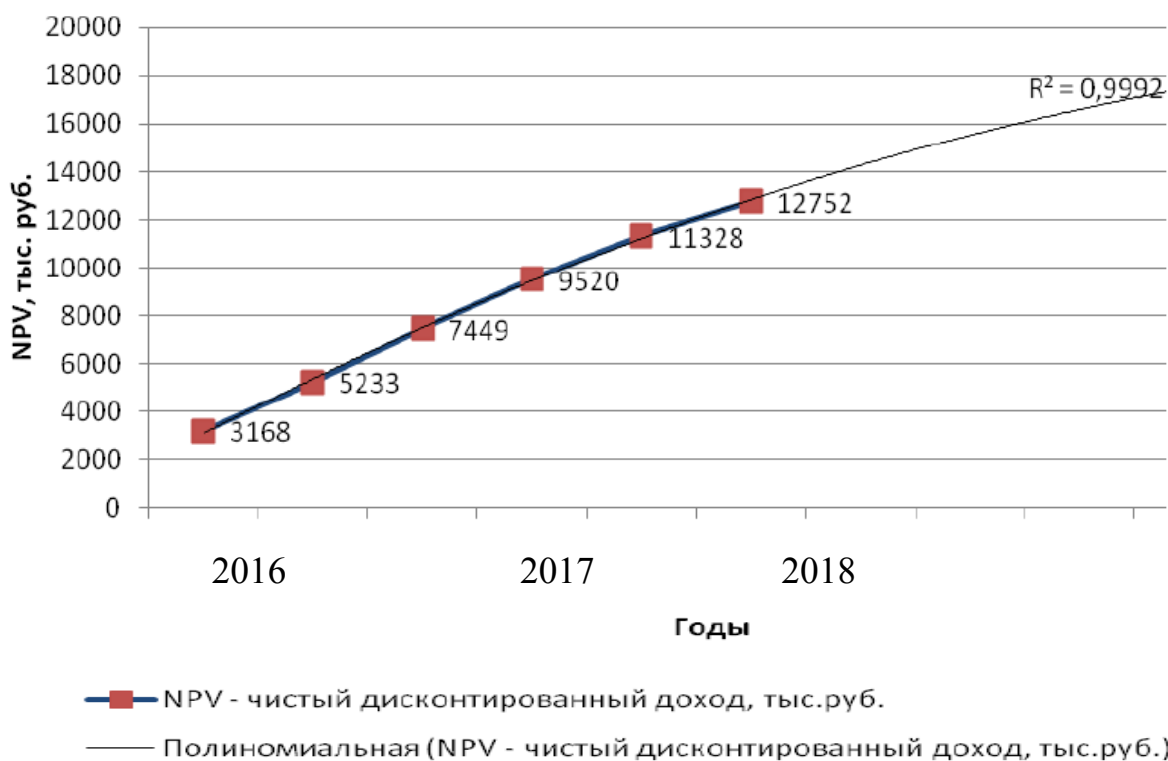
Рис. 5 График чистого дисконтированного дохода от мероприятий по совершенствованию системы оценки эффективности использования кадрового потенциала организации в ООО «Шелковые пути» 32

По полученным расчетам чистого дисконтированного дохода (NPV) строим график, состоящий из 6 шагов и представим в виде рис. 5.